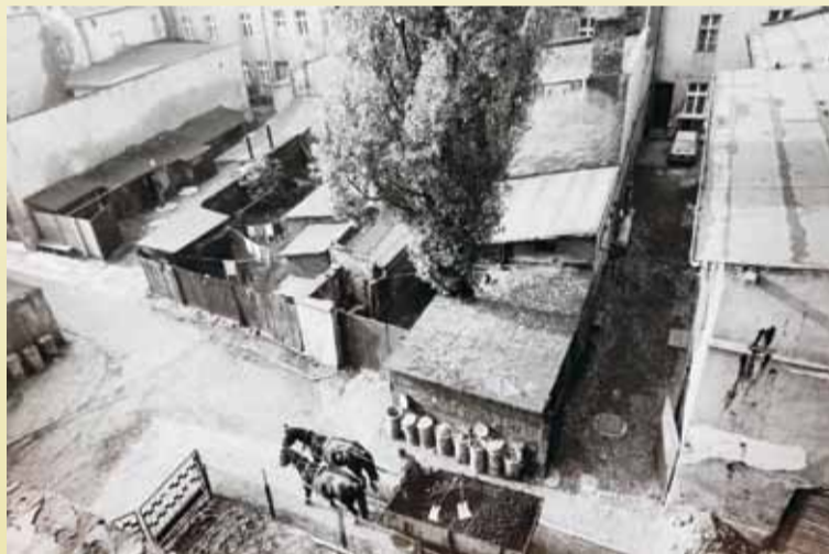
Kamsiada, lata 80. XX w.

ne płyty nagrobne (macewy) z żydowskich cmentarzy, a jeszcze inni przywoływali historię zagłady tego ludu, zagłady zgotowanej mu przez niemieckich nazistów, hitlerowców w mundurach Wehrmachtu. Z opowieści mojej matki, córki przedwojennego kępińskiego policjanta, dowiedziałem się z kolei, że ten lubiany przez mieszkańców starszy przodownik, jeżeli już bił po pyskach, to tylko tych, którzy pod koniec lat 30. dokuczali kilkunastu pozostałym w Kępnie żydowskim rodzinom lub optowali za hitlerowskimi Niemcami, co w końcu stało się faktem po wkroczeniu niemieckiej władzy do Kępna i przyjęło kształt podpisów na volksliście. Ponieważ rodziny moich rodziców nie przyłączyły się do grona polskich folksdojców, moja przyszła matka i mój przyszły ojciec zostali jako nastolatki wywiezieni do III Rzeszy jako robotnicy przymusowi. Tam też poznali się już po wyzwoleniu w strefie amerykańskiej i jako para wrócili do Wielkopolski w 1946 r.