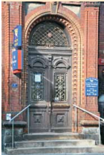
Drzwi przed renowacją

tryny i elementy zabytkowe odrzwi z końca XIX wieku. Zamontowanie „nowych” zrekonstruowanych zabytkowych drzwi nastąpiło 7 maja br.