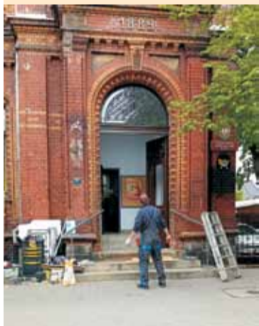
Montaż nowych drzwi