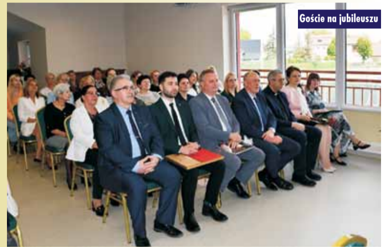
Goście na jubileuszu