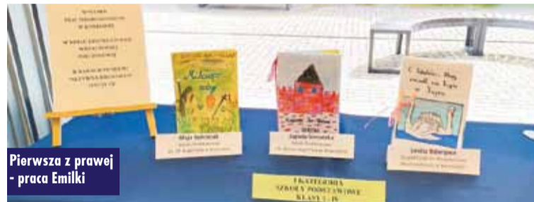
Pierwsza z prawej - praca Emilki