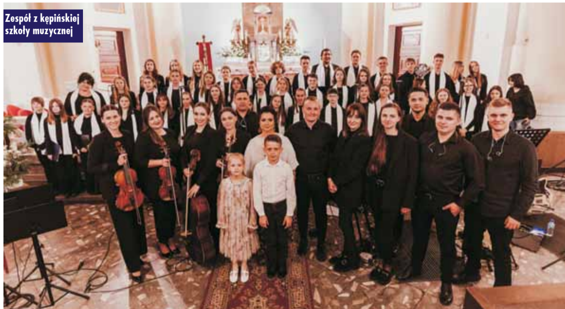
Zespół z kępińskiej szkoły muzycznej