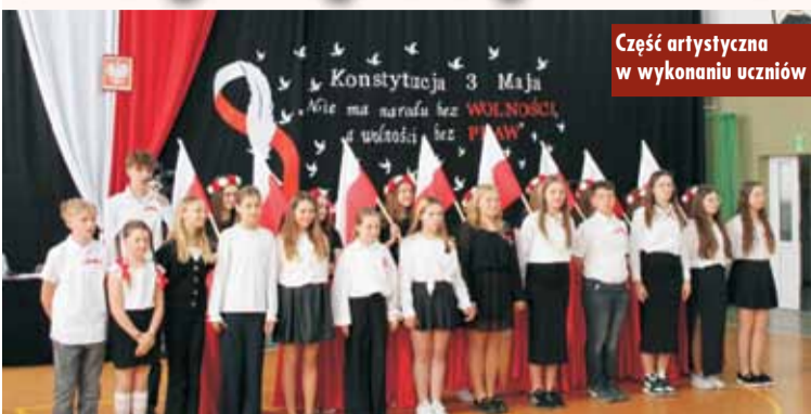
Część artystyczna w wykonaniu uczniów

Gminne obchody 234. rocznicy uchwalenia Konstytucji 3 Maja rozpoczęły się uroczystą mszą świętą w intencji ojczyzny w kościele parafialnym w Nowej Wsi Książęcej.