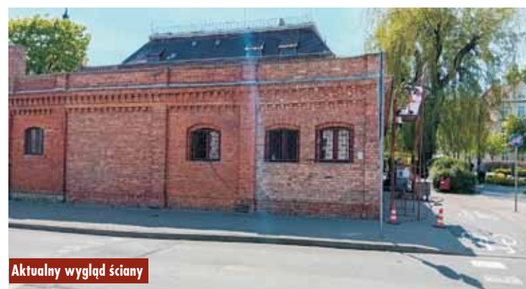
Aktualny wygląd ściany

Historii nie da się zamalować czy wygumkować. Ona trwa i pozostanie tu na zawsze.