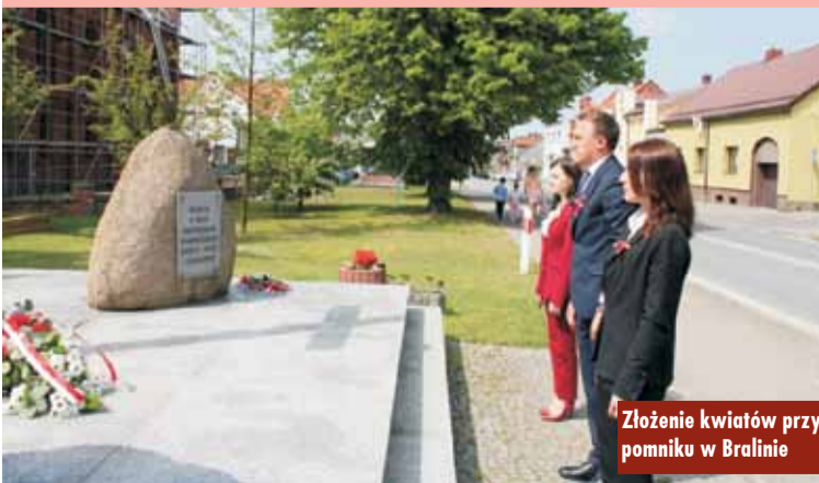
Złożenie kwiatów przy pomniku w Bralinie