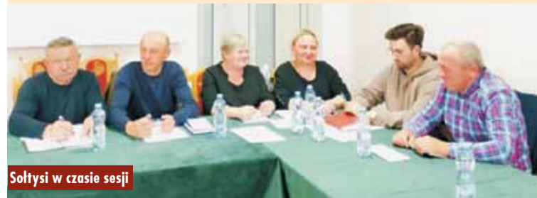
Sołtysi w czasie sesji