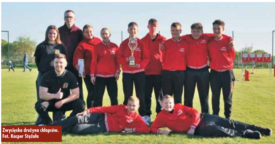
Zwycięska drużyna chłopów.