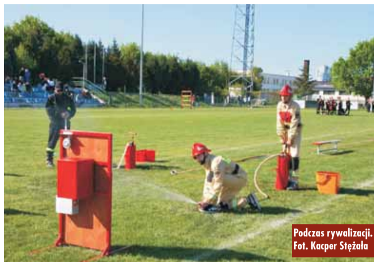
Podczas rywalizacji.