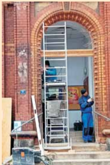
Pierwsza faza renowacji