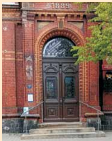
Drzwi po renowacji