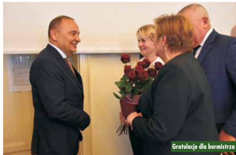
Gratulacje dla burmistrza

dziło przedstawienie raportu o stanie gminy, a także pozytywne opinie Regionalnej Izby Obrachunkowej oraz Komisji Rewizyjnej i Budżetowej Rady Miejskiej. Oprac. KR