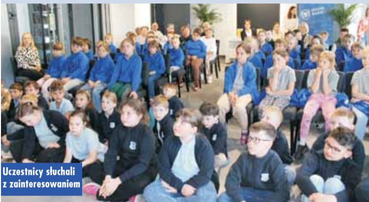
Uczestnicy słuchali z zainteresowaniem

Dużą część spotkania poświęciła osobie i twórczości swojej mamy, a uczniowie mieli okazję wysłuchać utworów znanej wszystkim Wandy Chotomskiej . Uczestnicy mogli również posłuchać piosenek z repertuaru „Fasolek”, a dorośli przypomnieli sobie utwory, które znali i śpiewali w dzieciństwie: „Pan Tik-Tak”, „Mydło lubi zabawę”, „Myj zęby”, „Moja fantazja” i wiele innych. W trakcie wizyty autorka zachęcała zebranych do codziennego czytania książek i odwiedzania biblioteki. Podkreślała, że czytanie nie tylko poszerza wiedzę, ale również rozwija wyobraźnię, która jest bardzo ważna. Spotkanie było dowodem na to, że książka łą-