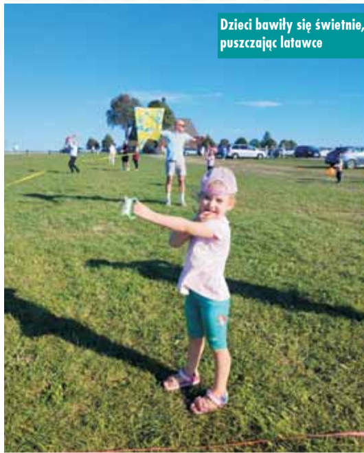
Dzieci bawiły się świetnie, puszczając latawce

To już kolejny raz, kiedy mieszkańcy gminy, dzieci, rodzice, dziadkowie i młodzież spotkali się, by wspólnie przeżyć wyjątkowe, rodzinne popołudnie pełne radości, integracji i dobrej zabawy. Organizatorzy – członkowie Akcji Katolickiej – po raz kolejny pokazali, jak wielką wartość mają inicjatywy promujące rodzinne spędzanie czasu oraz aktywność na świeżym powietrzu. Tradycyjnie, po zakończeniu lotów, rodziny zebrały się przy ognisku, aby wspólnie piec kielbaski i