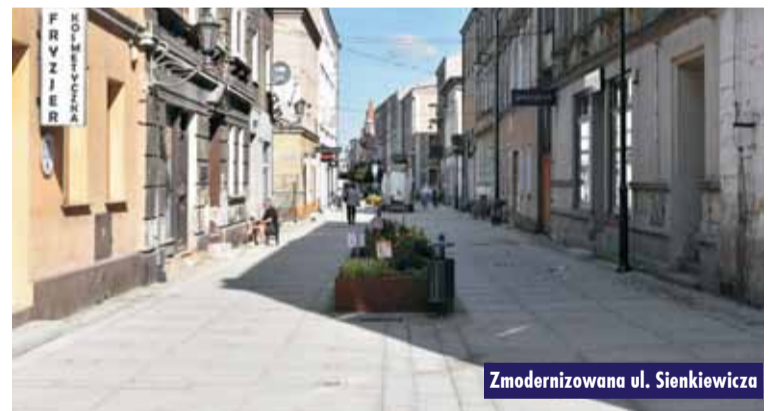
Zmodernizowana ul. Sienkiewicza

Zakończono prace wykończeniowe prowadzone w ramach rewitalizacji ul. Sienkiewicza, od Rynku do ul. Ks. P. Wawrzyniaka. Wykonane zostały roboty w zakresie infrastruktury