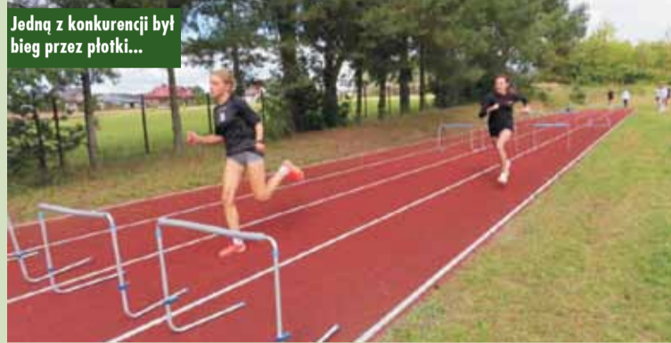
Jedną z konkurencji był bieg przez płotki...