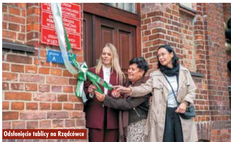
Odsłonięcie tablicy na Rządcówce