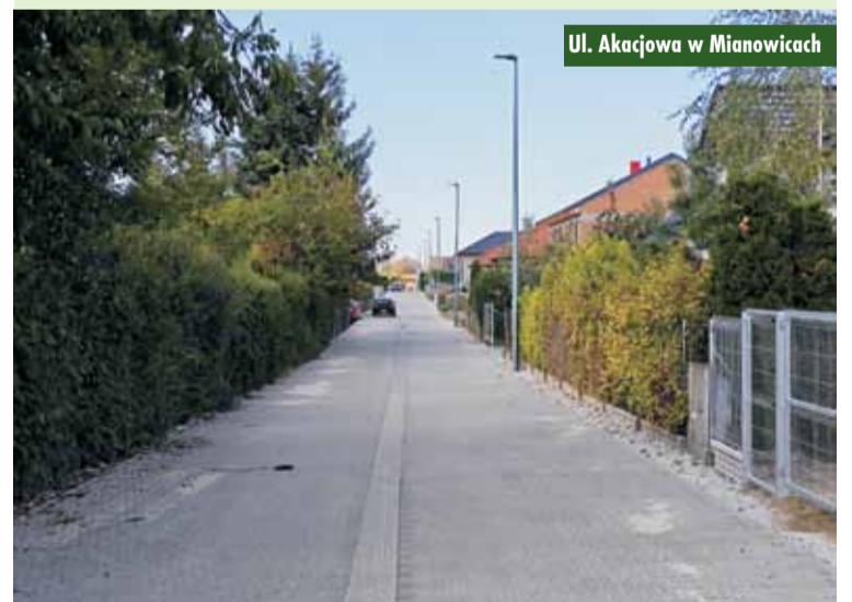
Ul. Akacyjowa w Mianowicach

Zakończyła się realizacja budowy ulicy Akacyjowej w Mianowicach. W ramach inwestycji wykonana została droga o nawierzchni z kostki betonowej, o szerokości 5 m na długości 392 m, wraz z obustronnymi utwardzonymi