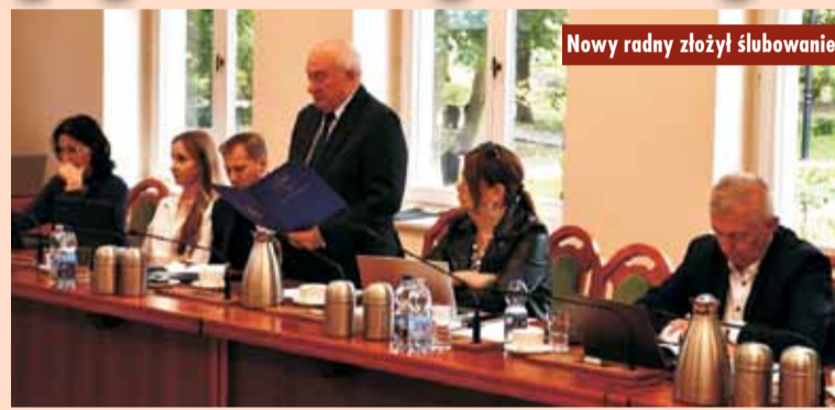
Nowy radny złożył ślubowanie