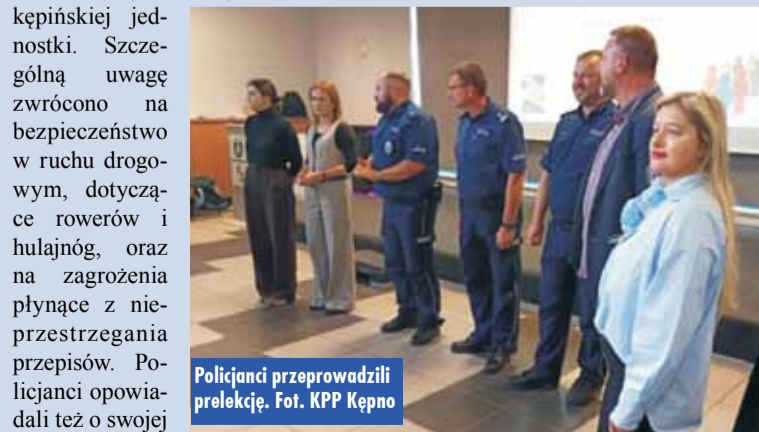
Policjanci przeprowadzili prelekcję.

temat bezpieczeństwa. Przedstawili dane statystyczne dotyczące działań kępińskiej jednostki. Szczególną uwagę zwrócono na bezpieczeństwo w ruchu drogowym, dotyczące rowerów i hulajnóg, oraz na zagrożenia płynące z nieprzestrzegania przepisów. Policjanci opowiadali też o swojej