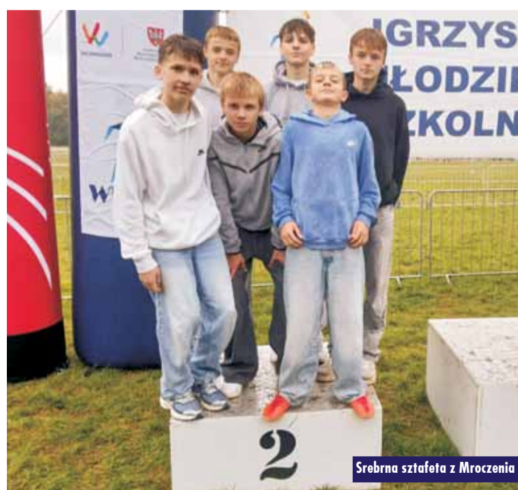
Srebrna sztafeta z Mroczenia