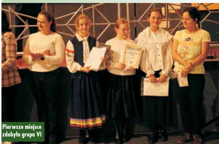
Pierwsze miejsce zdobyła grupa VI