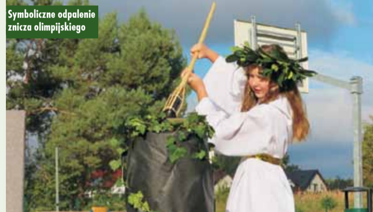
Symboliczne odpalenie znicza olimpijskiego

swoich sił, ale przede wszystkim czas integracji, wspólnej zabawy i promowania aktywnego stylu życia. Nie zabrakło również rywalizacji dru-