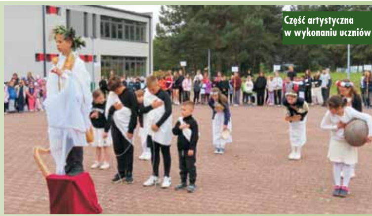
Część artystyczna w wykonaniu uczniów

uczyć wartości, które pozostają z dziećmi na całe życie. To był dzień pełen uśmiechu, zdrowej rywalizacji i wspólnego świętowania – z pewnością na długo pozostanie w pamięci uczestników. JS