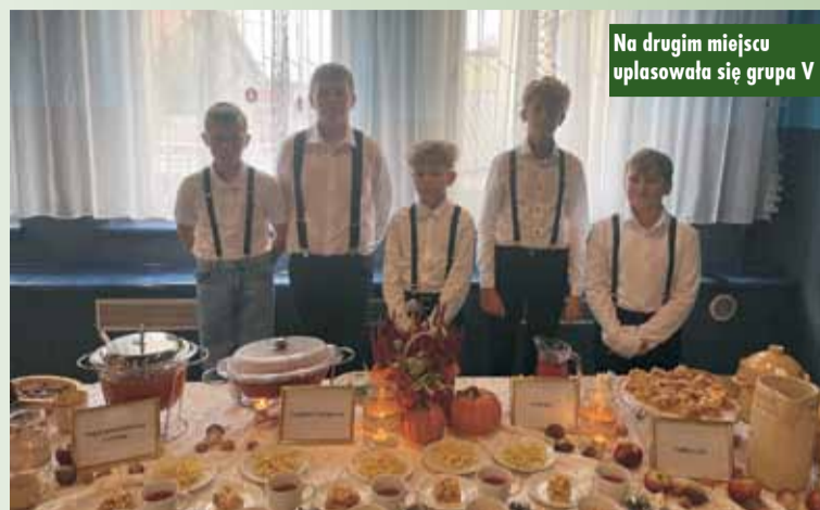
Na drugim miejscu uplasowała się grupa V