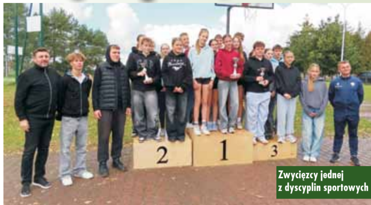
Zwycięzcy jednej z dyscyplin sportowych

29 września br. Szkoła Podstawowa im. Jana Pawła II w Mikorzynie po raz kolejny stała się gospodarzem wyjątkowego wydarzenia – Małej Olimpiady Sportowej, organizowanej przez Stowarzyszenie Absolwentów i Przyjaciół Szkoły „Otwarte Drzwi” we współpracy ze szkołą. Inicjatywa została współfinansowana przez Gminę Kępno.