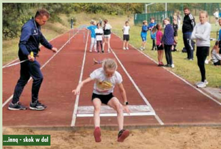
...inną - skok w dal

W Zespole Szkół Ponadpodstawowych nr 2 w Kępnie odbyła się debata społeczna z policjantami