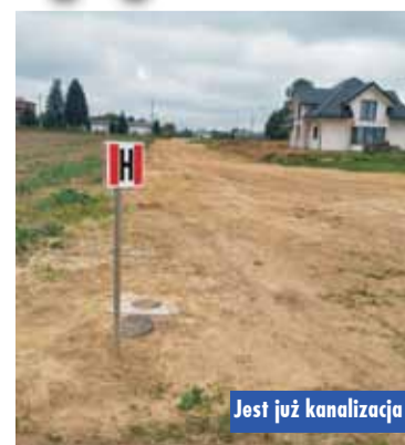
Jest już kanalizacja

W ramach realizacji zadania wykonano odcinek sieci wodociągowej o długości 200 mb z rur PEHD o średnicy 110 mm oraz odcinek kanalizacji sanitarnej o długości 175 mb.