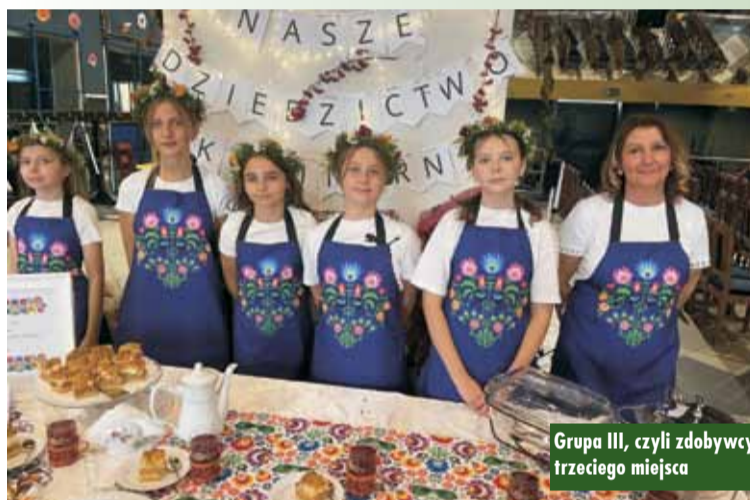
Grupa III, czyli zdobywcy trzeciego miejsca

X Lokalny Festiwal Smaku „Moje dziedzictwo kulinarne” po raz kolejny udowodnił, że kuchnia to coś więcej niż tylko gotowanie. To opowieść o rodzinie, o wspomnieniach, o więziach, które łączą ludzi przy jednym stole. Młodzi uczestnicy pokazali, że tradycja wciąż żyje – i ma przed sobą smakowitą przyszłość. A. Tyra